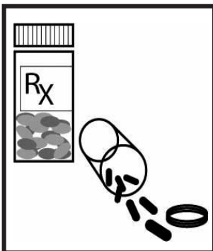
Cuide sus medicamentos